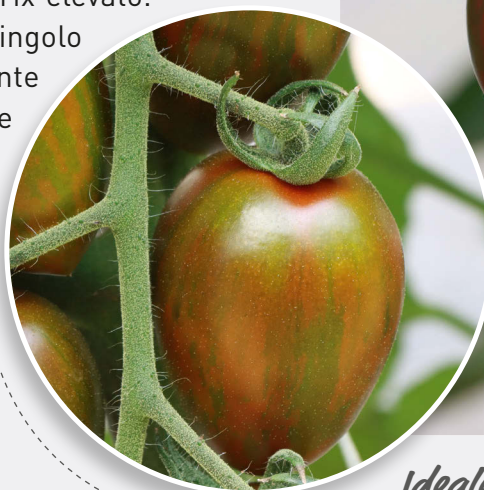
Colore con striature particolari